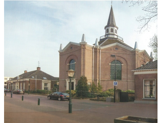
De kerk aan de Jhr. von Heijdenstraat

De eredienst vindt plaats in protestantse kerk in de Jhr. von Heijdenstraat. De voormalig gereformeerde kerk (Maranathakerk) en de voormalige hervormde kerk in Buurse zijn voor de erediensten niet meer in gebruik.